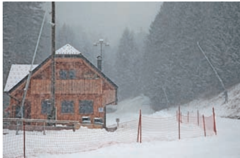
Na smučišču Rudno imajo več novih pridobitev, med drugim so posodobili sistem zasneževanja.