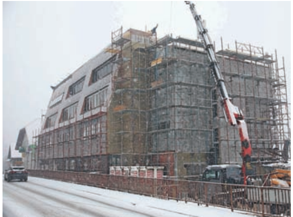
V prvi fazi bodo obnovili streho ter izdelali fasado, vhod v stavbo in jašek za dvigalo.